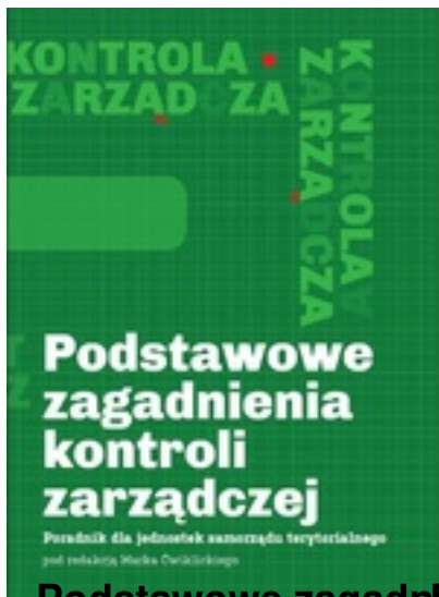
Podstawowe zagadnienia kontroli zarządczej samorządu terytorialnego