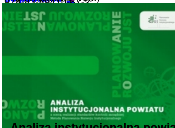
Analiza instytucjonalna powiatu z oceną realizacji standardów kontroli zarządczej