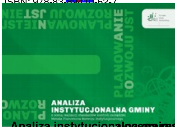
Analiza instytucjonalna gminy z oceną realizacji standardów kontroli zarządczej